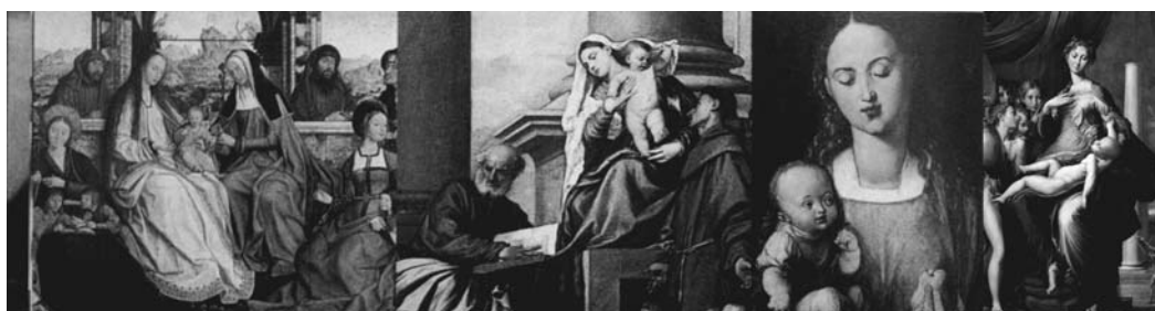
1509. Квентин Массейс. Триптих со Святой Анной. Брюссель, Королевские музеи 1524–1526. Тициан. Алтарь Пезаро. Венеция, Санта Мариа Деи Фрари Ок. 1526. Альбрехт Дюрер. Мадонна с грушей (галерея Уффици) 1532. Пармиджанино. Мадонна с длинной шеей. Флоренция, Палаццо Питти