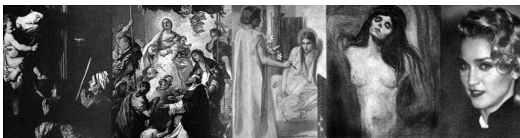
Ок. 1604. Караваджо. Мадонна с паломниками. Рим, Сант Агостино Ок. 1686. Лука Джордано. Мадонна с четками (Мадонна под балдахинном). Неаполь, музей Каподимонте 1849–1850. Данте Габриэле Россетти. Ессе ancilla Domini. Лондон, Галерея Тейт 1894–1895. Эдвард Мунк. Мадонна. Осло, Национальная галерея 1991. Мадонна (Луиза Вероника Чикконе)