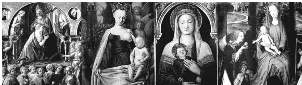
Ок. 1478. Хуго Ван дер Гус. Триптих Портинари (галерея Уффици). Ок. 1487. Сандро Боттичелли. Мадонна с гранатом (галерея Уффици) 1501–1505. Микеланджело. Тондо Дони (галерея Уффици) 1504–1508. Рафаэль. Мадонна с щегленком (галерея Уффици)